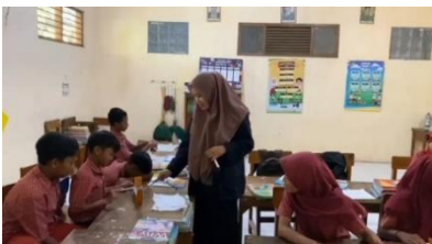
Gambar 3. Memainkan Alat musik Gamelan

Penggunaan alat musik saron dalam pembelajaran Pancasila terbukti mendukung tujuan pendidikan kewarganegaraan, yaitu membentuk warga negara yang memahami hak dan kewajibannya serta memiliki karakter yang kuat. Lagu-lagu nasional yang diiringi dengan alat musik lokal membantu siswa memahami simbol dan nilai Pancasila secara konkret. Indriawati (2023) mengungkapkan bahwa pendidikan pancasila kewarganegaraan pada siswa sekolah dasar yang mengintegrasikan pendekatan budaya lokal sangat efektif dalam menanamkan sikap nasionalisme sejak usia dini. Dengan demikian, saron tidak hanya berfungsi sebagai media seni, tetapi juga sebagai alat edukatif yang kontekstual dan mendalam (Indriawati, 2023).